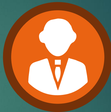
Некоммерческие организации и их представители