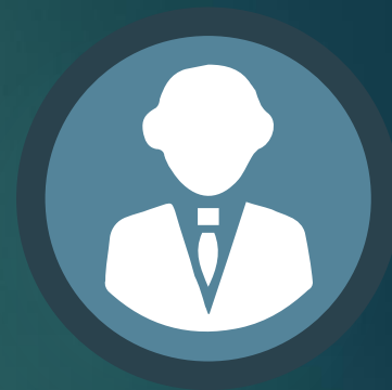
Наблюдатели общественные и международные наблюдатели